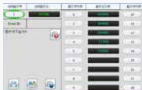
配方功能, 更换产品只需调用相应的配方号