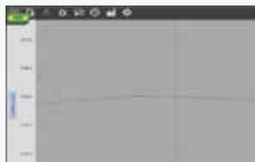
灌装重量自优化功能