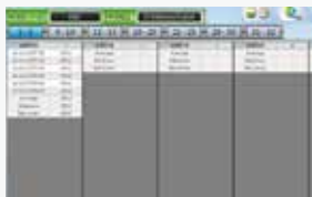
数据采集与分析功能